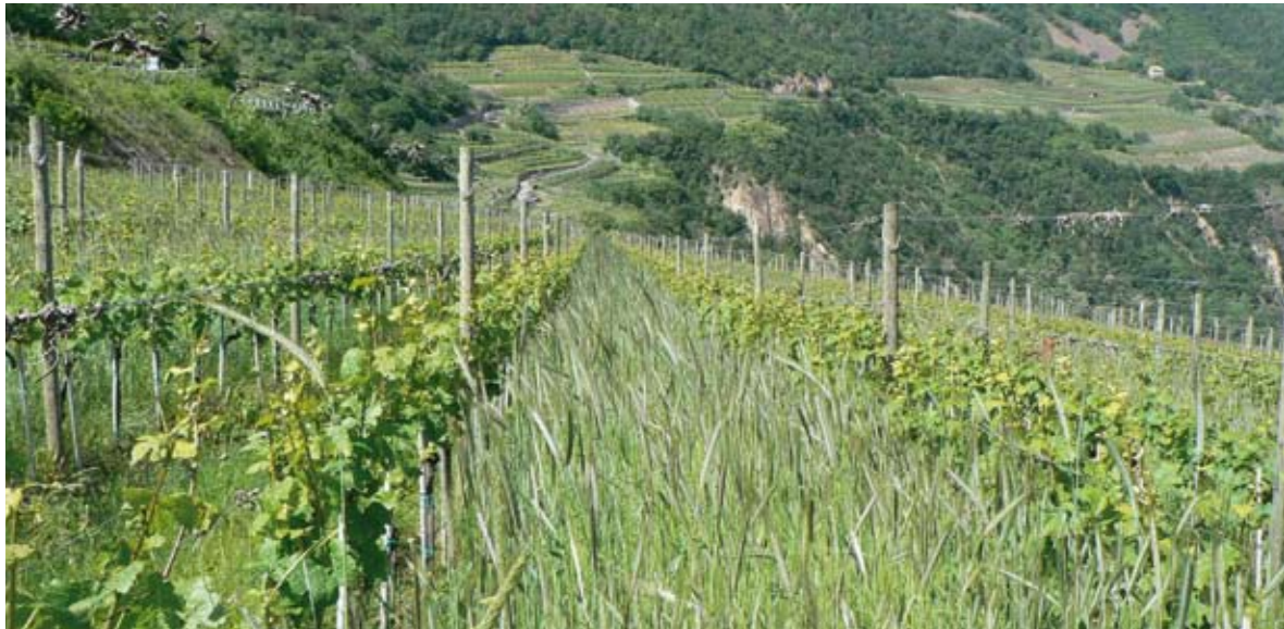
Il sovescio a Maso Franch

Tutto questo nella convinzione che taluni territori viticoli, con le loro peculiarità, rappresentano sicuramente una realtà concreta e unica dove giocano emozioni, sensazioni e il piacere che tale territorio trasmette. Il risultato: vini che ne sono l'emblema ma allo stesso tempo anche un valore economico maggiore e duraturo.